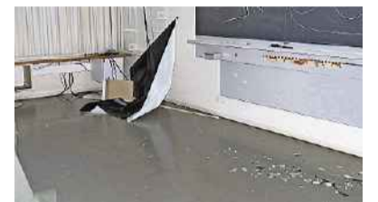
Vandalenakte in der Burghalde.

Unbekannte Täter haben Mitte Oktober im Badener Bezirksschulhaus Burghalde grossen Schaden angerichtet, wie die Kantonspolizei Aargau in einer Mitteilung schreibt. Sie sucht nun Zeugen. Die Täterschaft drang in der Zeit vom Freitag, 19. Oktober, und Dienstag, 23. Oktober, in das Gebäude ein, das derzeit renoviert wird. Sie zerschlugen Scheiben, beschädigten Mobiliar und versprayten Wände. Der Sachschaden beträgt mehrere zehntausend Franken. Die Stadt Baden stellte Strafantrag. Die Kantonspolizei hat Ermittlungen eingeleitet und nimmt Hinweise zur Klärung der Straftat und Ermittlung der Täterschaft entgegen (Tel. 056 200 11 11). (AZ)