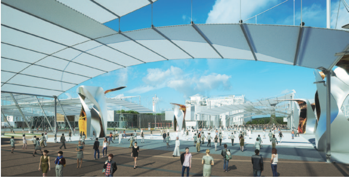
EXPO, Piazza Italia