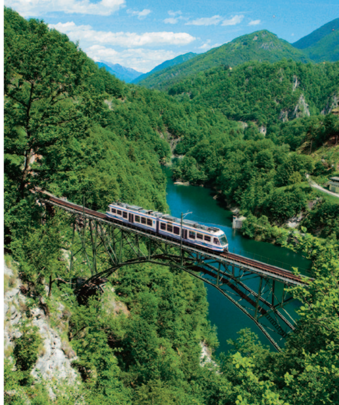
Panoramafahrt durch hundert Täler

Orta, «vernachlässigte Perle in Norditalien», besticht nicht nur durch ihre herrliche Landschaft, sondern beherbergt auch den Sacri Monti. Nicht ohne Grund gehört der Heilige Berg von Orta zu den UNESCO-Weltkulturerben. Nachdem Sie durch die engen Gassen des lieblichen Ortes geschlendert sind, geht es mit dem Boot weiter zur Insel San Giulio. Auf der einzigen Insel im Ortasee findet der zweite Tag einen angemessenen und schönen Ausklang.