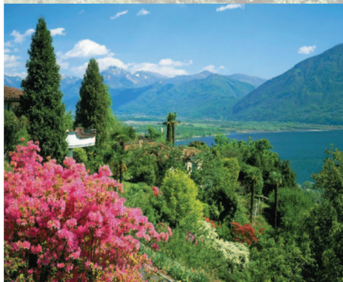
Blumenmeer am Lago Maggiore