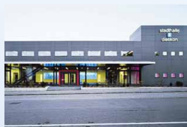
Stadthalle Dietikon