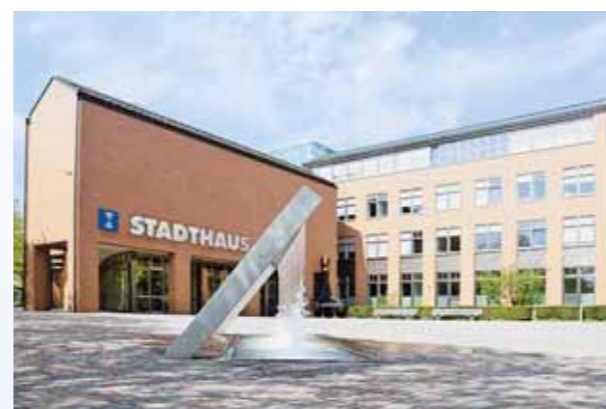
Stadthaus Dietikon