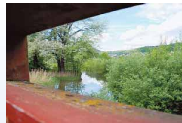
Dietiker Auenlandschaft