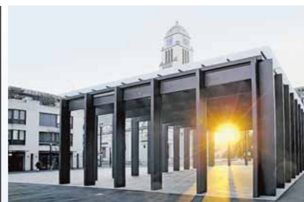
Markthalle von Dietikon