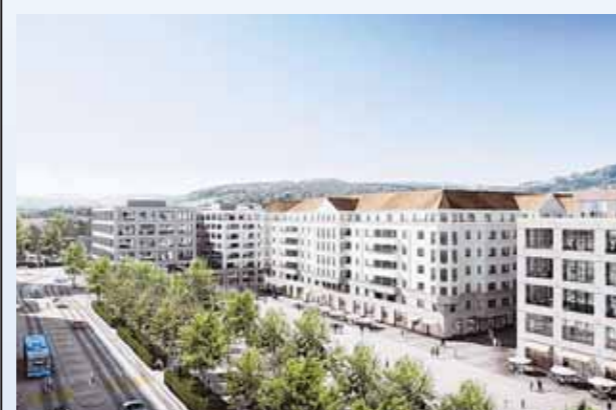
Animation des geplanten Stadtplatz Limmatfeld