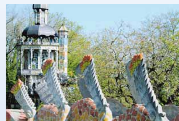
Fabelwelt Bruno Weber Skulpturenpark